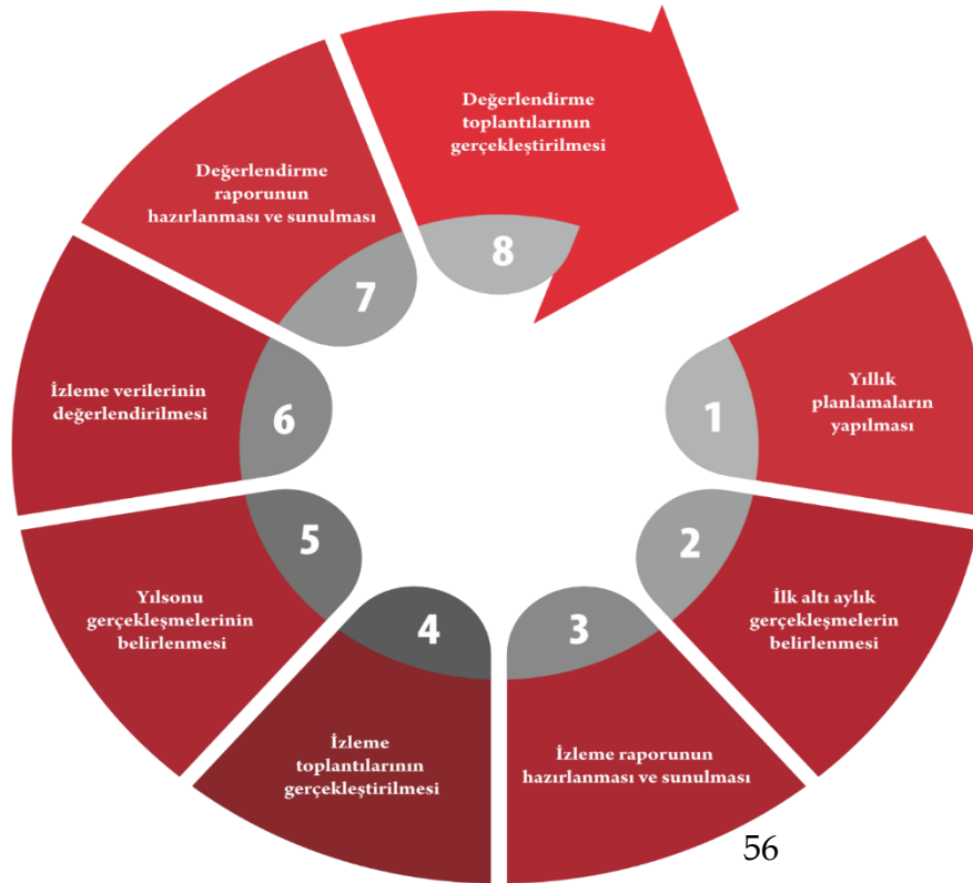
Şekil 2. İzleme Değerlendirme Süreci

Tatlıpınar İlk/Ortaokulu 2024-2028 Stratejik Plan'ının izleme ve değerlendirme süreci ve takvimi Şekil 2' de ifade edilmiştir.